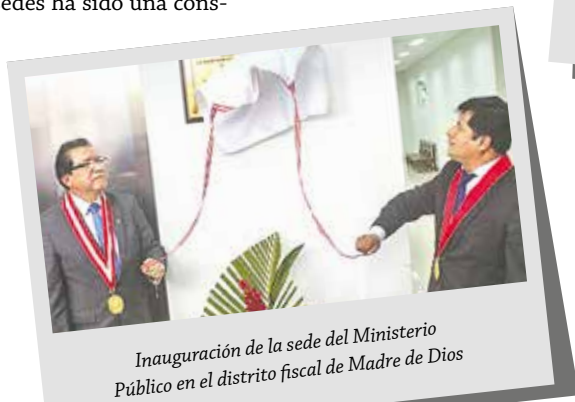
Inauguración de la sede del Ministerio Público en el distrito fiscal de Madre de Dios