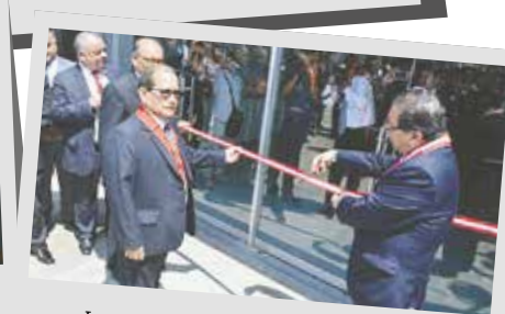
Inauguración de la sede del Ministerio Público en el distrito fiscal de Huaura