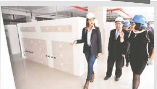
Recorrido por la futura sede central del Ministerio Público en Arequipa