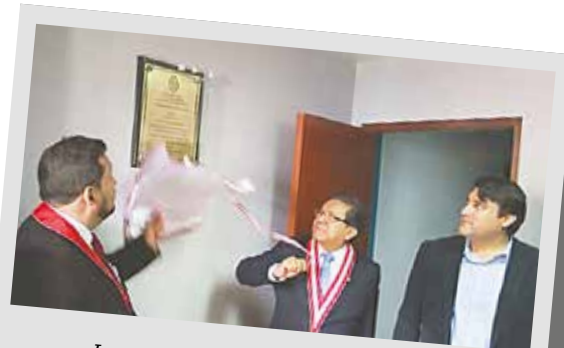
Inauguración de la Cámara Gesell en Celendín, Cajamarca

tante para el Fiscal de la Nación, Pablo Sánchez Velarde. Con ello, se logró un ahorro significativo para la institución de más de 380 mil soles mensuales, en alquiler de locales que no reunían las condiciones necesarias para el desempeño de la función fiscal y médico legal.