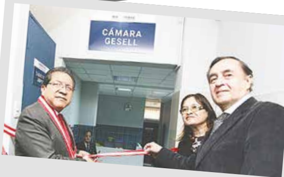
Inauguración de la Cámara Gesell en Huaycán