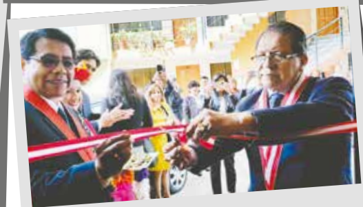
Inauguración de nuevas oficinas en Cusco