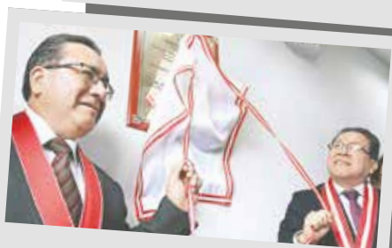
Inauguración de la Cámara Gesell en San Juan de Lurigancho