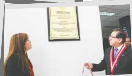
Inauguración de sede del Ministerio Público en el distrito de José Leonardo Ortiz, en Chiclayo